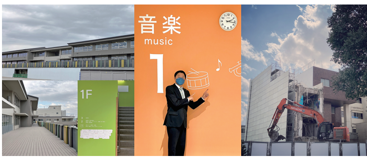
↑改築後の新八小校舎。 ↑取り壊し中の旧六小校舎

改築第1期校八小・一中が完成し、新学期を迎えました。進行中の第2期校三小・六小は令和6年度3学期をめざしています。被災時には体育館エアコンに加え、トイレ・保健室など必要な機能が使えるようLPガスを採用。また、今年度のトイレ改修は白糸台小、五中も対象に。