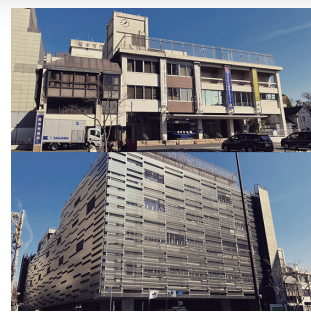
←現庁舎 ←新庁舎「おもや」

外装が露わになった新庁舎「おもや」も5月引き渡し～8月14日(木)開庁に向けて準備が進められています。設計段階から障がい者団体の方々の要望や検証の実施を促すなど、UD(ユニバーサルデザイン)検定等で学んだことを活かしながら取り組んできました。